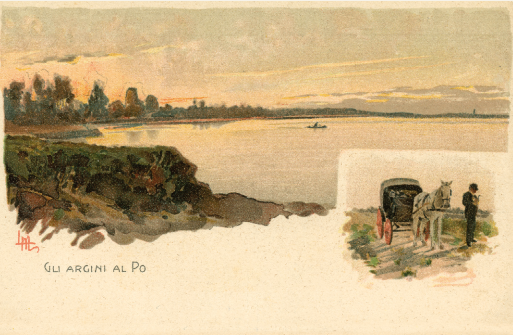
GLI ARGINI AL PO