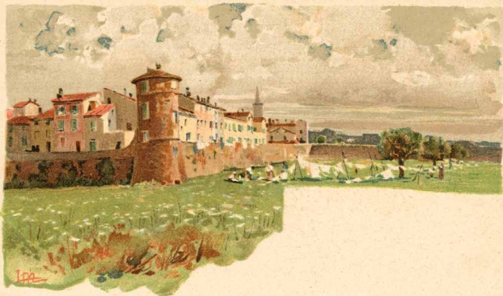
LE MURA DI BUSSETO