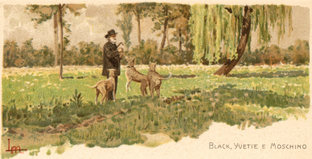
BLACK, YVETTE E MOSCHINO