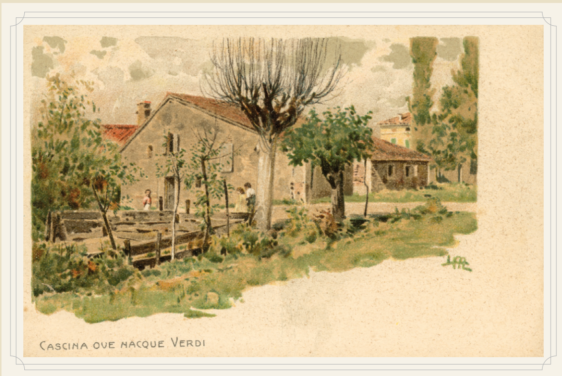
CASCINA OVE NACQUE VERDI