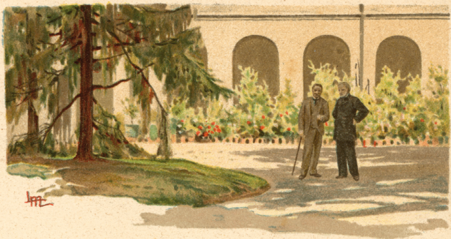
BOITO E VERDI