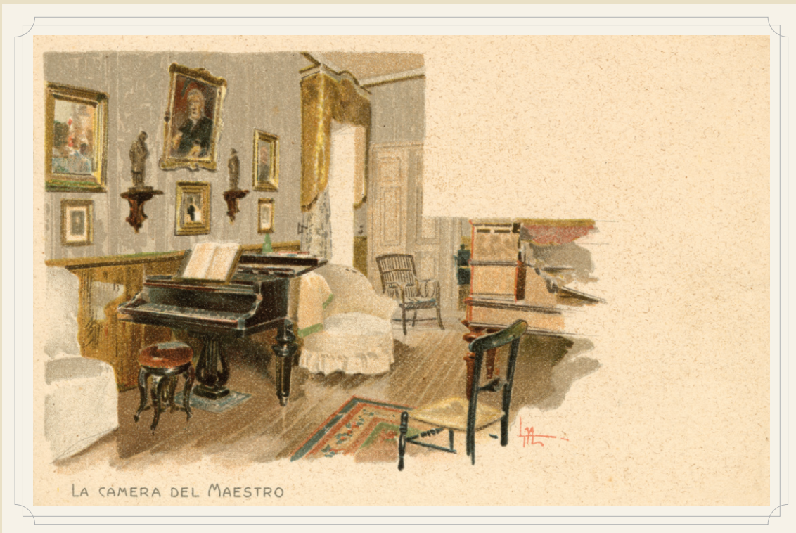
LA CAMERA DEL MAESTRO