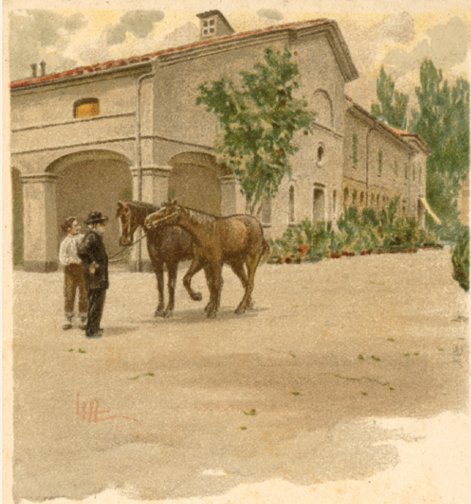
I DUE FAVORITI